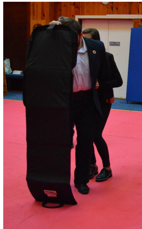
Obrázok č.2 Grafické znázornenie hmatového vnímania s využitím balistickej tašky. .

Hmatové vnímanie považujeme pri výkone činnosti osobnej ochrany taktiež za veľmi dôležité. Nároky, ktoré sú vo všeobecnosti kladené na hmatové vnímanie rozdeľujeme na bežné a špecifické. Bežné nároky hmatového vnímania sú založené na schopnosti rozoznávania predmetov rôzneho druhu, veľkosti, tvaru v úplne bežných podmienkach. Pri vymedzovaní špecifických vlastností hmatového vnímania vychádzame zo skutočnosti, že k nim dochádza za určitých sťažených podmienok. V tomto prípade sa vyžaduje citlivejšie hmatové vnímanie na niektoré druhy fyzikálnych vlastností ako sú teplo, chlad, vlhkosť, vibrácie, elektrizovanie a iné. 8