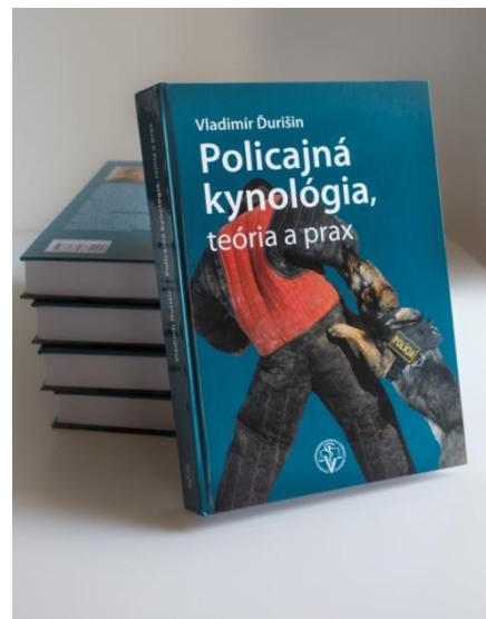
Policajná kynológia, teória a prax