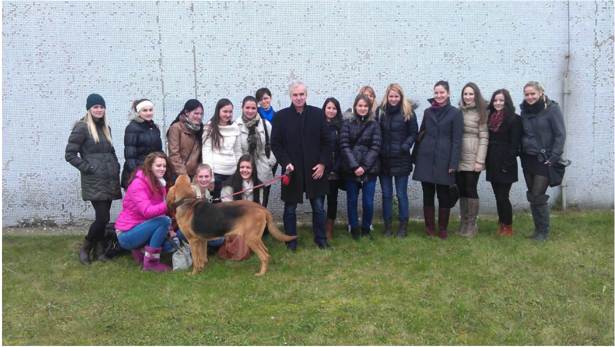
Autor so študentmi v rámci praktickej výučby predmetu